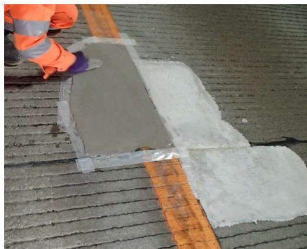
ポットホール補修