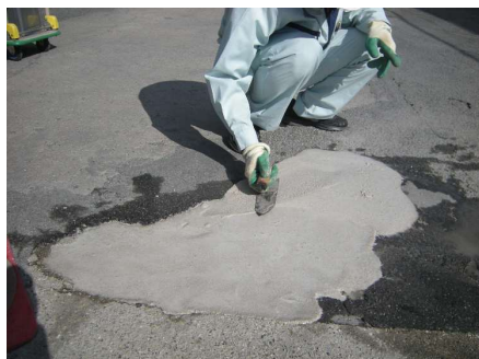
コンクリート舗装補修