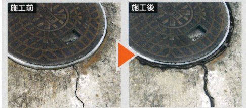
・目地充填 ・小規模な防水処理