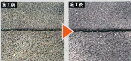
上下水道の復旧後のクラック補修